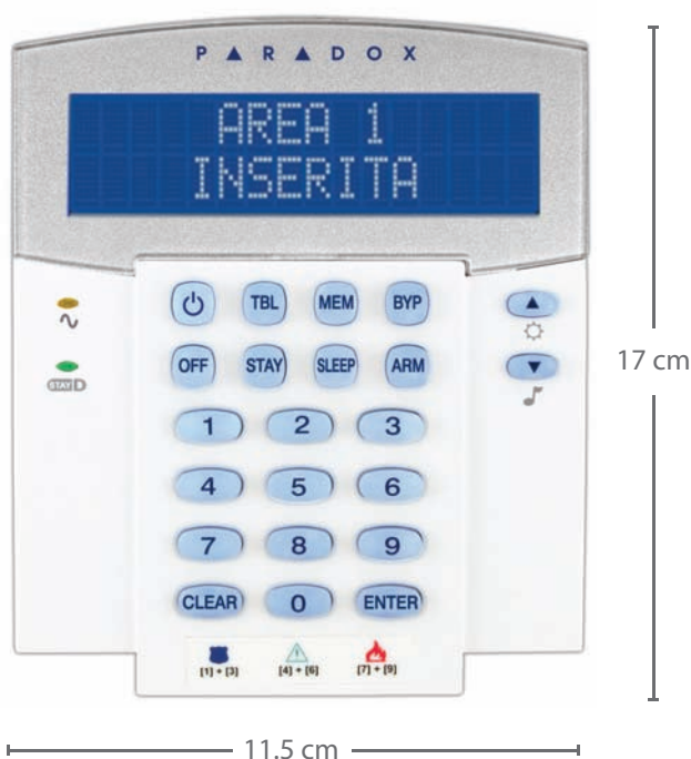
K32LCD Tastiera LCD cablata a 32 caratteri