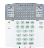
K32RF** Tastiera a LED senza fili 32 zone