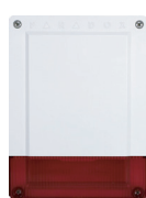
SR150 Sirena autoalimentata senza fili