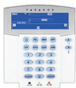
K37** Tastiera a LCD senza fili 32 zone