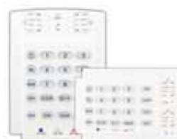
K10H/K10V Tastiere cablate con indicatori LED 10 zone