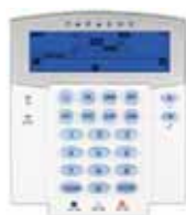
K32IRF/K32I Tastiera senza fili/cablata con visualizzatore LED a icone