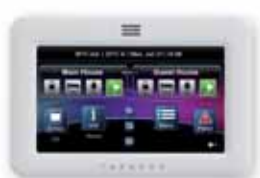
TM-50 Tastiera Touchscreen

La maggior parte dei falsi allarmi avviene per errori causati dal proprietario del sistema di sicurezza che usa delle tastiere molto complicate. Le tastiere dei sistemi MG5000 e MG5050 sono state realizzate per offrire la massima chiarezza e semplicità d'uso.