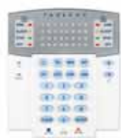
K32RF/K32 Tastiere senza fili/cablata con indicatori LED 32 zone