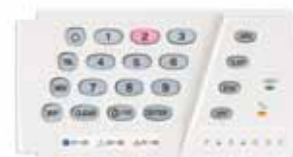
K636 Tastiere cablate con indicatori LED 10 zone